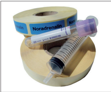
Abb. 1: Anwendungspalette für Etiketten.

Keine andere Branche hat eine so breite Anwendungspalette für Etiketten wie die Medizin und Pharma-Industrie. Es gilt, ein hohes Niveau an Produktunterscheidungen und Spezifikationen zu gewährleisten. Oft sind Zulassungen, Zertifikate und technische Dokumentationen erforderlich. Im Folgenden werden die besonderen Ansprüche behandelt, die für Medizin- und Pharma-Etiketten gefordert werden (Abb. 1):